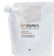
Blonde Divine odfarbovací prášok 500 g OE12015