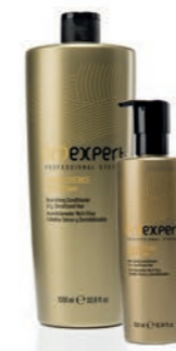
Vyživujúci kondicionér 1000 ml - OE15027 300 ml - OE15028