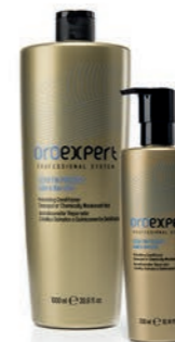
Rekonštrukčný kondicionér 1000 ml - OE14035 300 ml - OE14036