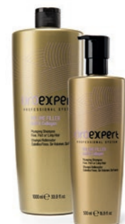
Šampón pre objem 1000 ml - OE17042 500 ml - OE17043