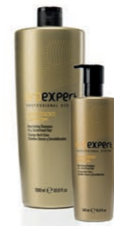
Vyživujúci šampón 1000 ml - OE15025 500 ml - OE15026