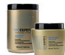
Rekonštrukčná maska 1000 ml - OE14038 500 ml - OE14037