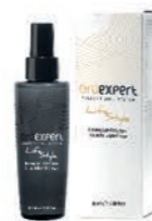
Sprej pre lesk vlasov 100 ml OE18144