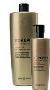
Ochranný šampón 1000 ml - OE13017 500 ml - OE13018