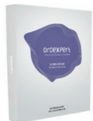
Oroexpert Blonde Nirvana vzorkovník farieb