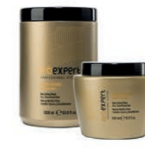
Vyživujúca maska 1000 ml - OE15030 500 ml - OE15029