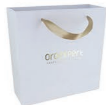
Oroexpert darčeková taška