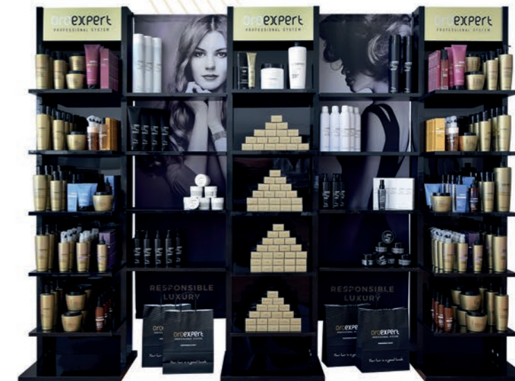
Oroexpert triple stojan