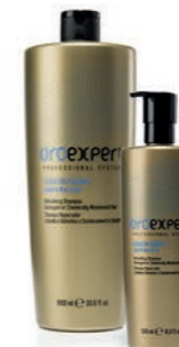
Rekonštrukčný šampón 1000 ml - OE14033 500 ml - OE14034