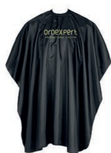
Oroexpert kadernícka pláštenka