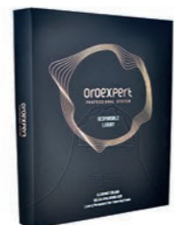
Oroexpert vzorkovník farieb