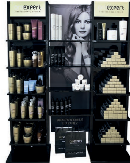
Oroexpert double stojan