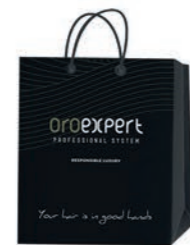
Oroexpert papierová taška