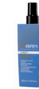
ALMIGHTY 10 in 1 200 ml OE14040