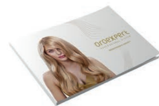
Oroexpert produktový katalóg