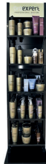
Oroexpert single stojan