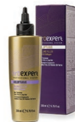
VOLUPTUOUS 200 ml OE17044