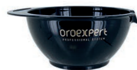
Oroexpert miska na farbenie