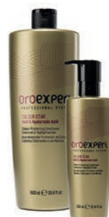
Ochranný kondicionér 1000 ml - OE13019 300 ml - OE13020