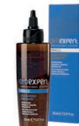
MIRACLE 150 ml OE14039