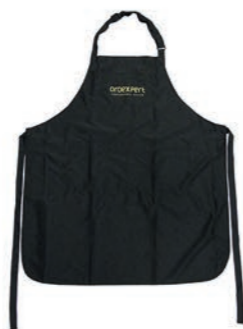
Oroexpert zástera na farbenie